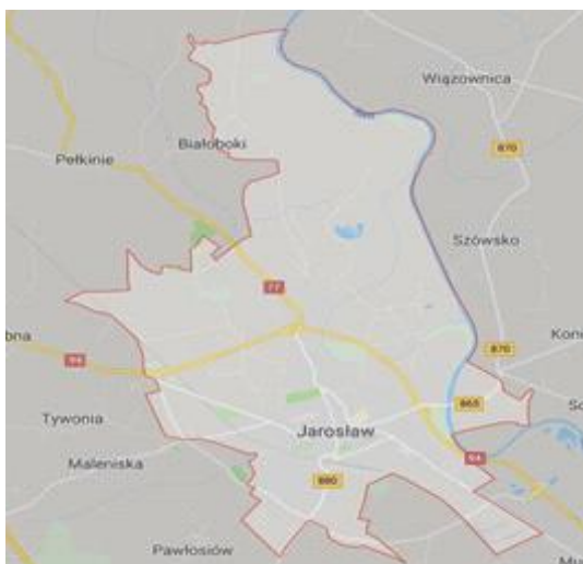
Rysunek 1: Granice miasta

Geograficznie Jarosław jest zlokalizowany we wschodniej części województwa podkarpackiego. Miasto położone jest na pograniczu Podgórze Rzeszowskiego (zwanego również Podgórzem Jarosławskim) i Doliny Dolnego Sanu, leży w sąsiedztwie trzech gmin wiejskich: Jarosław, Wiązownica i Pawłosiów. Położone jest na przebiegu ważnych szlaków komunikacyjnych Polski południowej. Jarosław oddalony jest 55 km od Rzeszowa (układem drogowym) oraz 59 km od lotniska w Jasionce k. Rzeszowa. Od przejścia granicznego z Ukrainą w Korczowej Jarosław dzieli zaledwie 36 km. Ważnymi elementami układu drogowego są przebiegająca od południowej strony miasta autostrada A4 (będąca elementem trasy europejskiej E40) w kierunku wschód-zachód (biegnąca od Jędrzychowic przy granicy z Niemcami do przejścia granicznego z Ukrainą w Korczowej) oraz - w kierunku północ-południe - droga krajowa nr 77. W związku z bliskością autostrady, niedaleko miasta znajdują się dwa węzły autostradowe: Jarosław Zachód (łączy autostradę z drogą krajową nr 94) i Jarosław Wschód (łączy autostradę z drogą wojewódzką nr 880). Natomiast od strony północnej miasta biegnie droga krajowa nr 94, będąca alternatywną trasą dla autostrady. W 2012 r. otwarto obwodnicę miasta Jarosławia.