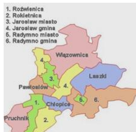
Rysunek 2: Gminy sąsiadujące

Powierzchnia miasta wynosi 34,46 km 2 , co stanowi 3,4% powierzchni powiatu i 0,2% powierzchni województwa. 72% powierzchni gminy stanowią użytki rolne. Biorąc to pod uwagę oraz dość wysokie - na tle województwa - zaludnienie miasta, należy przyjąć, że centrum miasta jest obszarem silnie zurbanizowanym.