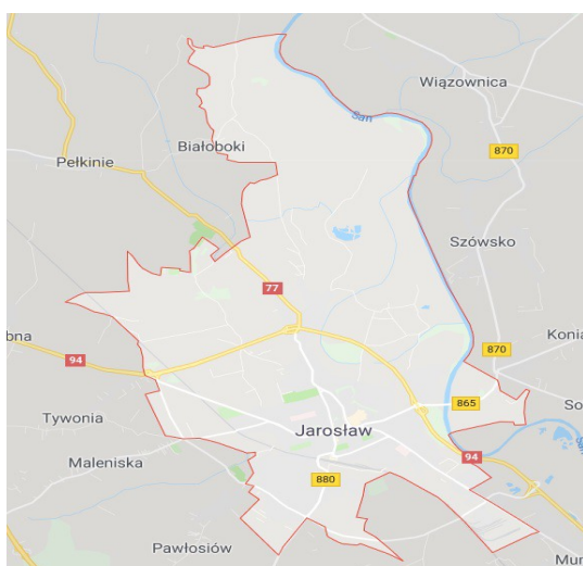
Rysunek 1: Granice miasta

Geograficznie Jarosław jest zlokalizowany we wschodniej części województwa podkarpackiego. Miasto położone jest na pograniczu Podgórze Rzeszowskiego (zwanego również Podgórzem Jarosławskim) i Doliny Dolnego Sanu, leży w sąsiedztwie trzech gmin wiejskich: Jarosław, Wiązownica i Pawłosiów. Położone jest na przebiegu ważnych szlaków komunikacyjnych Polski południowej. Jarosław oddalony jest 55 km od Rzeszowa (układem drogowym) oraz 59 km od lotniska w Jasionce k. Rzeszowa. Od przejścia granicznego z Ukrainą w Korczowej Jarosław dzieli zaledwie 36 km. Ważnymi elementami układu drogowego są przebiegająca od południowej strony miasta autostrada A4 (będąca elementem trasy europejskiej E40) w kierunku wschód-zachód (biegnąca od Jędrzychowic w Niemczech do przejścia granicznego z Ukrainą w Korczowej) oraz w kierunku północ-południe droga krajowa nr 77. W związku z bliskością autostrady niedaleko miasta znajdują się dwa węzły autostradowe: Jarosław Zachód (łączy autostradę z drogą krajową nr 94) i Jarosław Wschód (łączy autostradę z drogą wojewódzką nr 880). Natomiast od strony północnej miasta biegnie droga krajowa nr 94, będąca alternatywną trasą dla autostrady. W 2012 r. otwarto obwodnicę miasta Jarosławia.