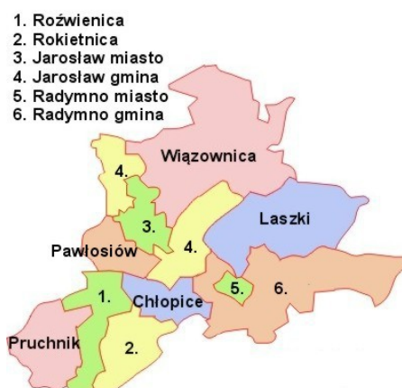
Rysunek 2: Gminy sąsiadujące

Powierzchnia miasta wynosi 34,46 km 2 , co stanowi 3,4% powierzchni powiatu i 0,2% powierzchni województwa. 72% powierzchni gminy stanowią użytki rolne. Biorąc to pod uwagę oraz dość wysokie zaludnienie miasta, o czym dalej, na tle województwa, należy przyjąć, że centrum miasta jest obszarem silnie zurbanizowanym.