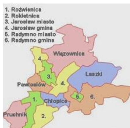
Rysunek 2: Gminy sąsiadujące

Powierzchnia miasta wynosi 34,46 km 2 , co stanowi 3,4% powierzchni powiatu i 0,2% powierzchni województwa. 72% powierzchni gminy stanowią użytki rolne. Biorąc to pod uwagę dość wysokie - na tle województwa - zaludnienie miasta, należy przyjąć, że centrum miasta jest obszarem silnie zurbanizowanym.