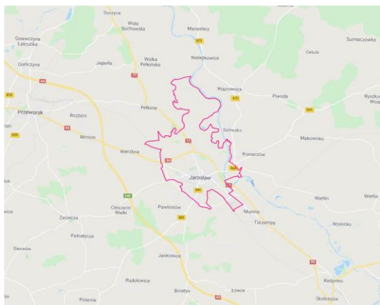
Rysunek 1: Granice miasta

Atutem Jarosławia jest jego położenie i wynikające z niego dogodne warunki komunikacji z ważnymi sąsiednimi ośrodkami. Położony jest we wschodniej części województwa podkarpackiego. Miasto leży na pograniczu Podgórze Rzeszowskiego (zwanego również Podgórzem Jarosławskim) i Doliny Dolnego Sanu, w sąsiedztwie trzech gmin wiejskich: Jarosławia, Wiązownicy i Pawłosiowa. Zlokalizowane jest na przebiegu ważnych szlaków komunikacyjnych Polski południowej. Miasto oddalone jest 55 km od Rzeszowa oraz 59 km od lotniska w Jasionce k. Rzeszowa. Od przejścia granicznego z Ukrainą w Korczowej Jarosław dzieli zaledwie 36 km. Ważnymi elementami układu drogowego są przebiegająca od południowej strony miasta autostrada A4 (będąca elementem trasy europejskiej E40) w kierunku wschód-zachód (biegnąca od Jędrzychowic przy granicy z Niemcami do przejścia granicznego z Ukrainą w Korczowej) oraz - w kierunku północ-południe - droga krajową nr 77. W związku z bliskością autostrady, niedaleko miasta znajdują się dwa węzły autostradowe: Jarosław Zachód (łączy autostradę z drogą krajową nr 94) i Jarosław - Wschód (łączy autostradę z drogą wojewódzką nr 880). Natomiast od strony północnej miasta biegnie droga krajowa nr 94, będąca alternatywną trasą dla autostrady. W 2012 r. otwarto obwodnicę miasta Jarosławia.